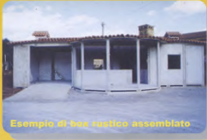
Esempio di box rustico assemblato