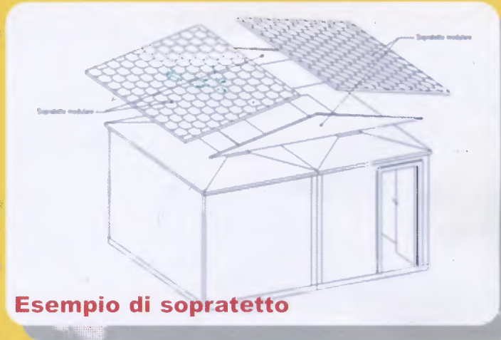
Esempio di sopratetto