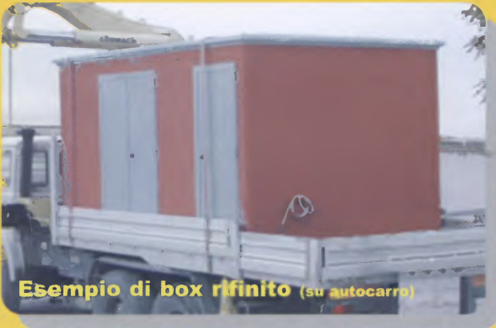
Esempio di box rifinito (su autocarro)