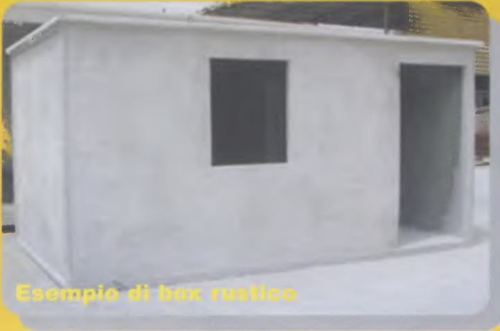
Esempio di box rustico