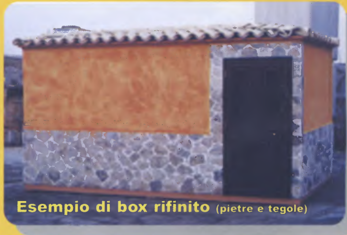
Esempio di box rifinito (pietre e tegole)