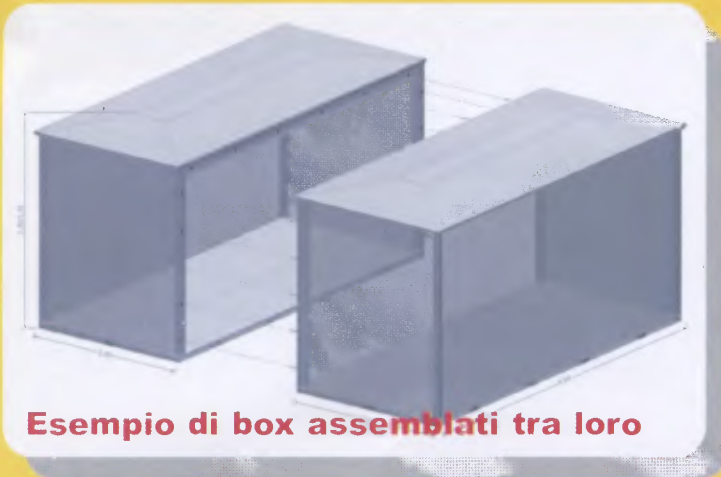
Esempio di box assemblati tra loro