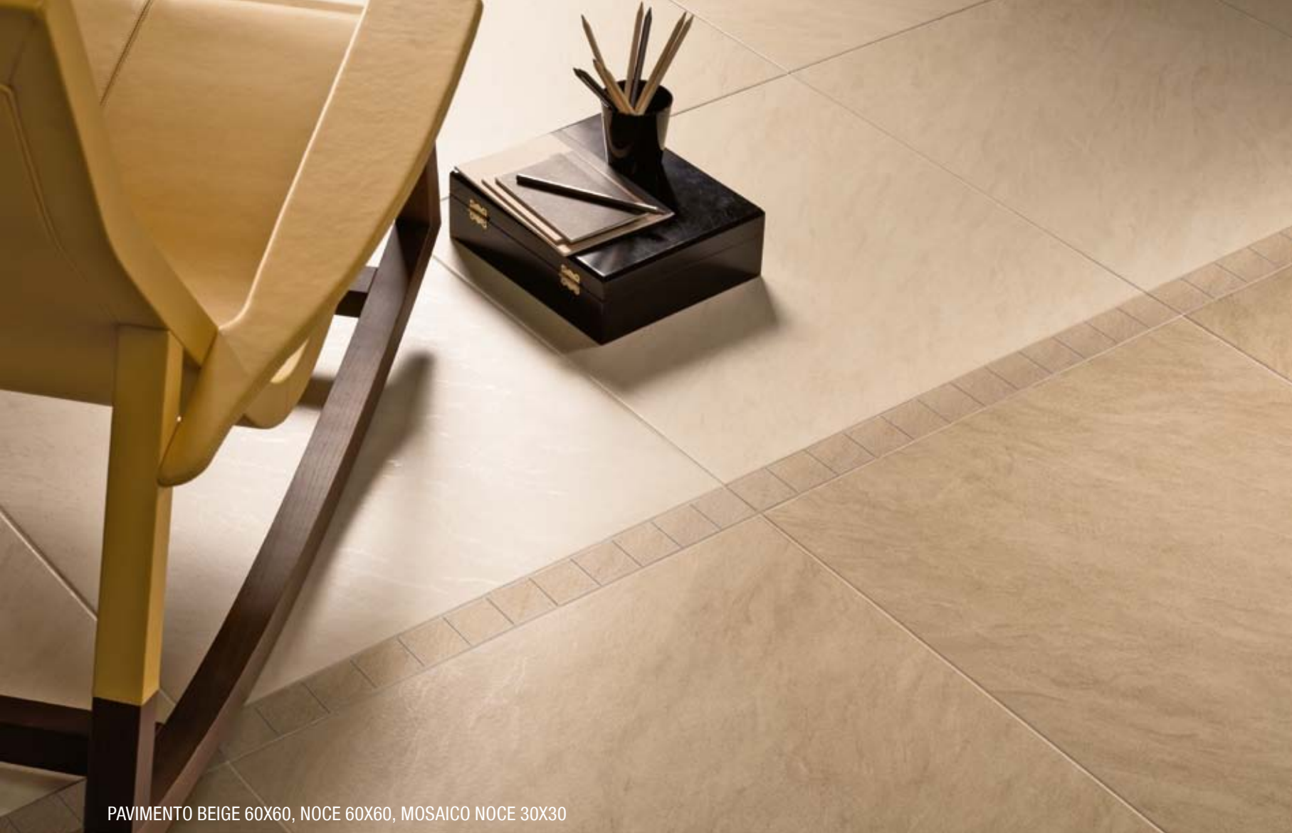
PAVIMENTO BEIGE 60X60, NOCE 60X60, MOSAICO NOCE 30X30