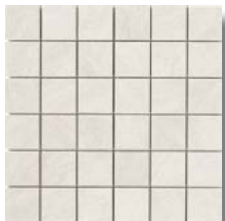
1. MOSAICO 30x30