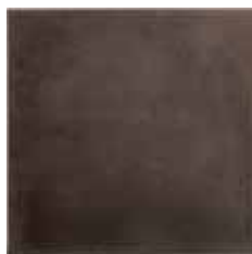
cod. 0013084 Primavera Caffè MQ/163 34x34 - 13 3/8 "x13 3/8 " BOX/12