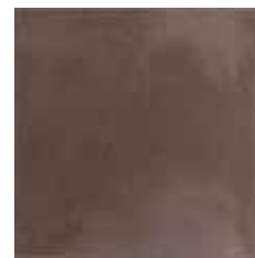
cod. 0013409 Primavera Brown MQ/163 34x34 - 13 3/8 "x13 3/8 " BOX/12