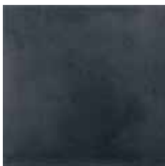
cod. 0013080 Primavera Antracite MQ/163 34x34 - 13 3/8 "x13 3/8 " BOX/12