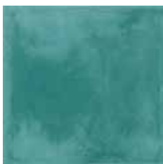
cod. 0013078 Primavera Smeraldo MQ/163 34x34 - 13 3/8 "x13 3/8 " BOX/12