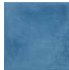
cod. 0013083 Primavera Blu MQ/163 34x34 - 13 3/8 "x13 3/8 " BOX/12