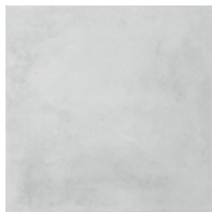
cod. 0013086 Primavera Grigio MQ/163 34x34 - 13 3/8 "x13 3/8 " BOX/12