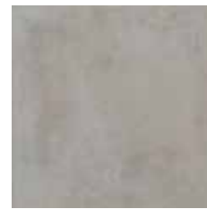
cod. 0013077 Primavera Tabacco MQ/163 34x34 - 13 3/8 "x13 3/8 " BOX/12