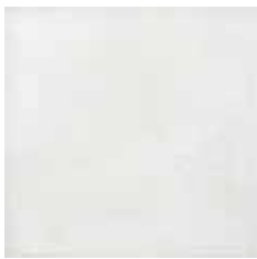
cod. 0013082 Primavera Bianco MQ/163 34x34 - 13 3/8 "x13 3/8 " BOX/12