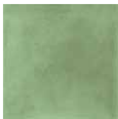
cod. 0013089 Primavera Verde Mela MQ/163 34x34 - 13 3/8 "x13 3/8 " BOX/12