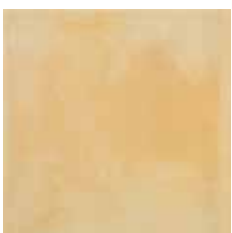
cod. 0013087 Primavera Ocra MQ/163 34x34 - 13 3/8 "x13 3/8 " BOX/12