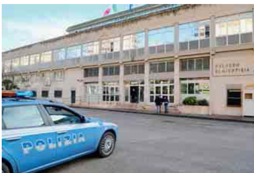
IL PALAZZO DI GIUSTIZIA IN VIA LIBERTÀ